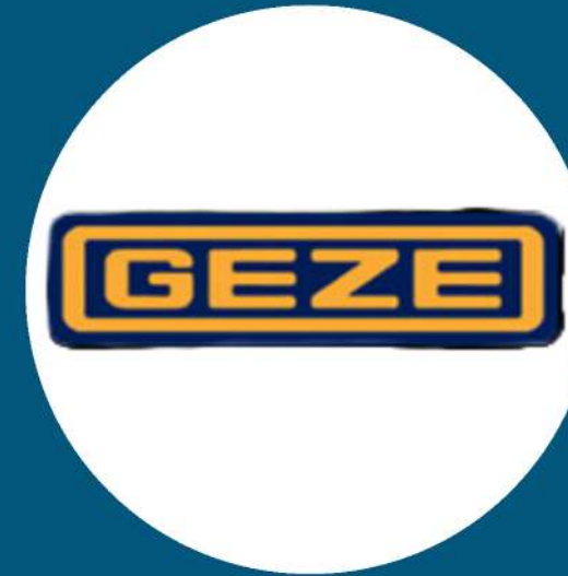
Geze German Accessories