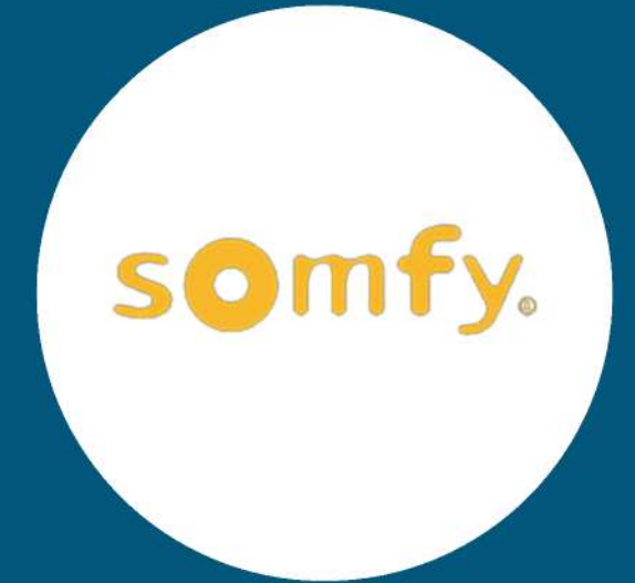
Somfy French Accessories