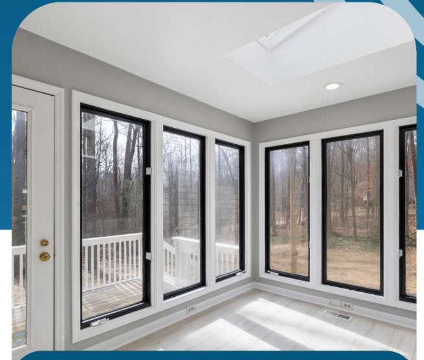
Aluminum Doors and Windows