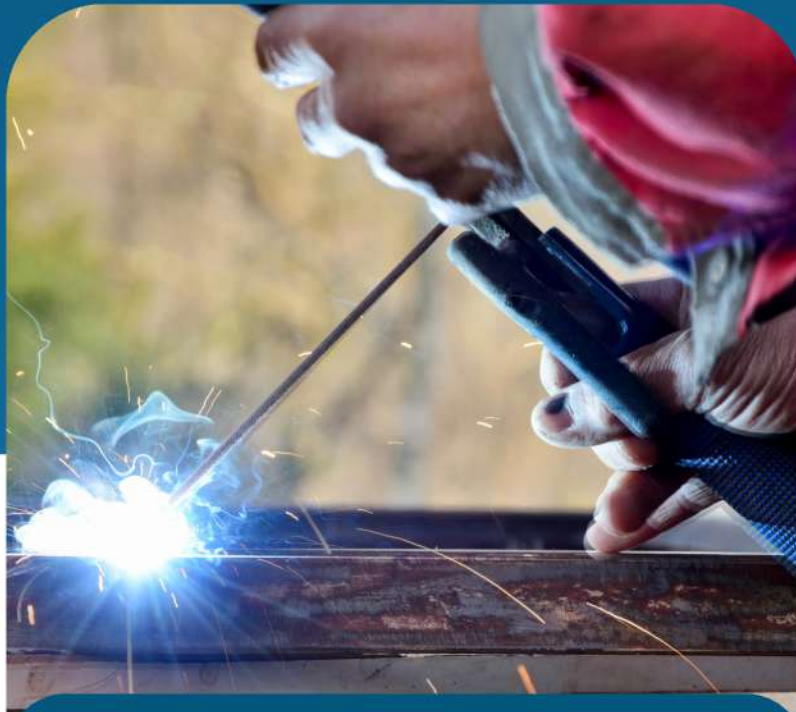
Structural Aluminum Fabrication