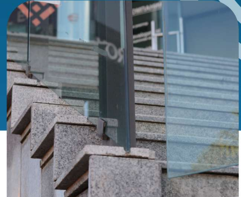
Glass Partitions and Railings