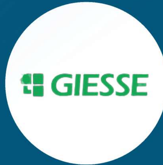
Giesse Italian Accessories