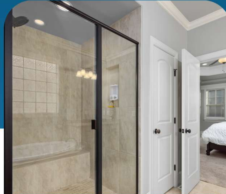
Custom Glass Solutions