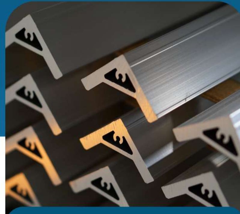
Custom Aluminum Profiles