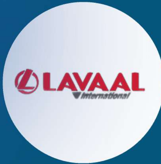
Lavaal Italian Accessories